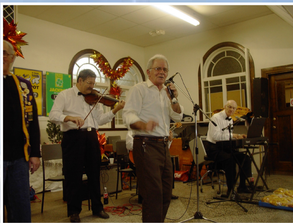
Passage obligé, sa chanson fétiche "Roses blanches de Corfou"