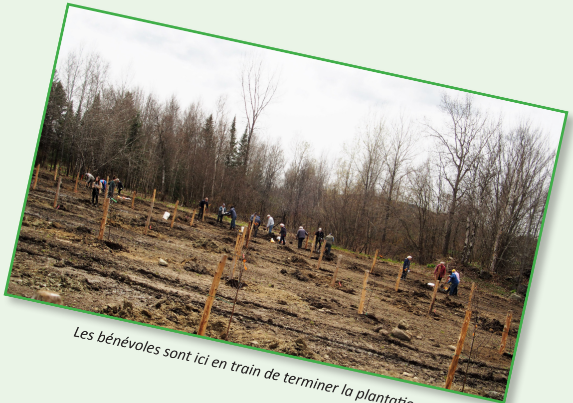
Les bénévoles sont ici en train de terminer la plantation.